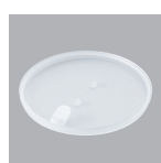
RUIPIA 中蓋 (PE)