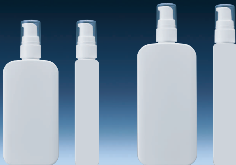
■ 画像左は正面から、右は側面から撮影したものです。