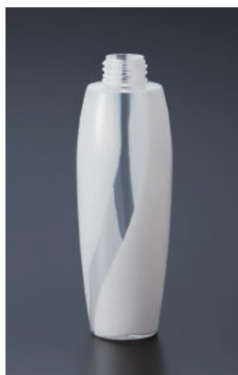
ツープロック / 180°ねじり