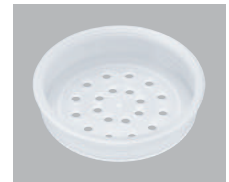
PFR-20 パウダー中蓋 (PE 2.5φ×20)