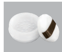
FR-20 ■ 中蓋のセレクトによりパウダー容器としてもご使用いただけます。