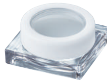
FQP ※パウダー仕様可のサイズがあります。