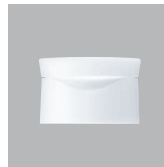
MFワンタッチ (PP 穴径 1.5φ)