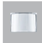
DMF-CAP (IN:PP OUT:AS)