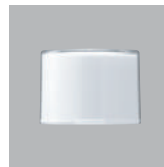
MFツーパーツ (IN:PP OUT:AS)