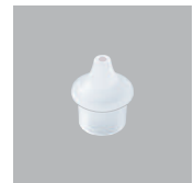
TMF中栓※ (PE 穴径 1.5φ)