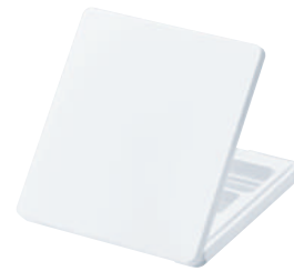
MONEチークコンパクト