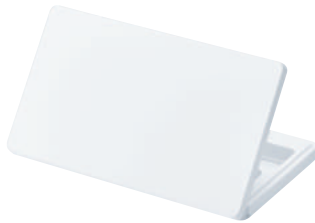
MONEシャドウコンパクト