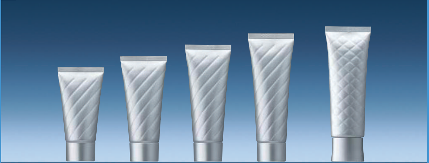
D-ALT40φ エンボス (スパイラル)