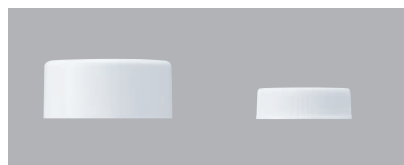
BATH-350アウターキャップ BATH-350インナーキャップ