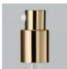
PCTポンプ金冠 (ボタン部金冠)