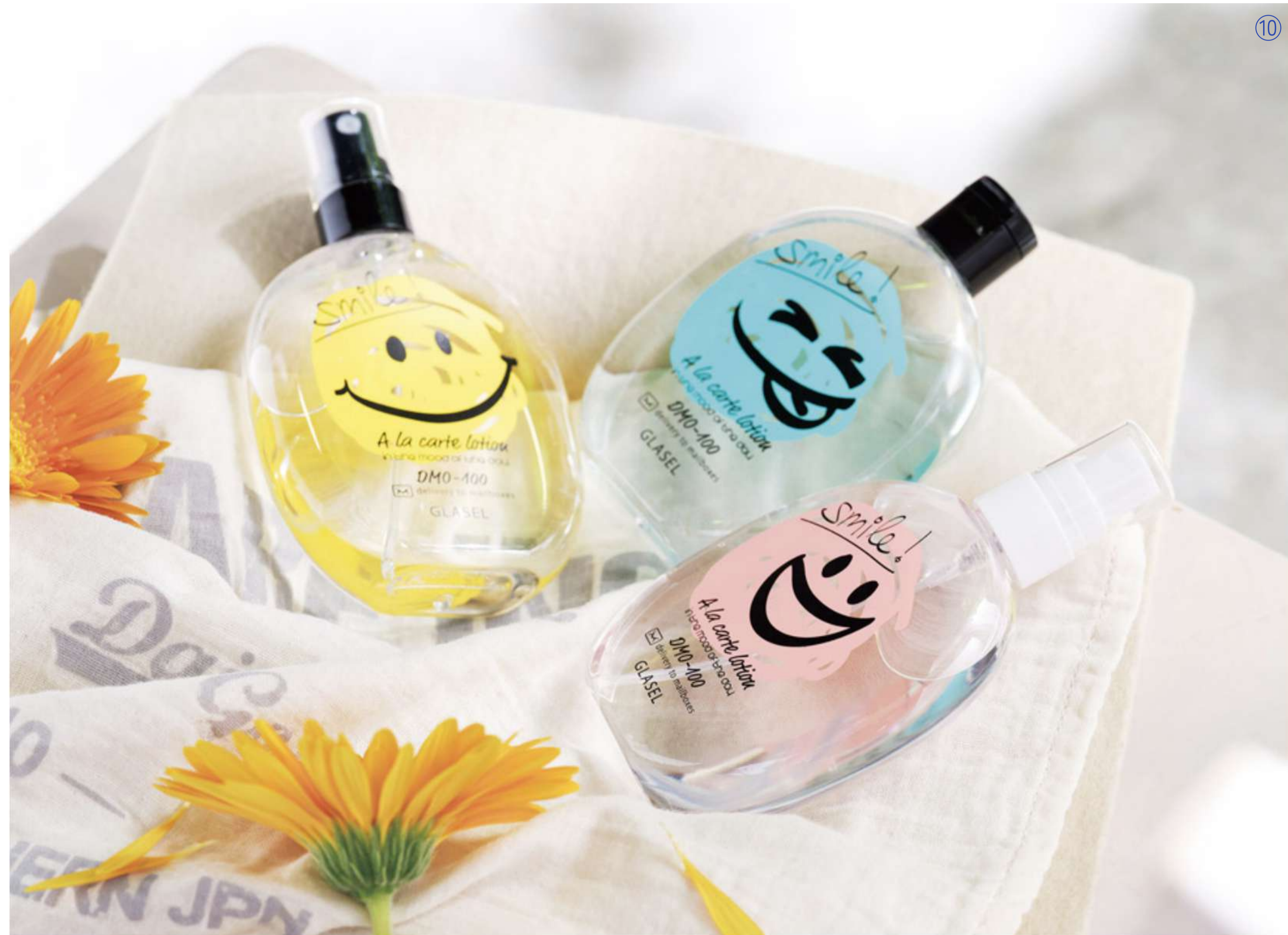
写真左から、DMO-100(Z-100-113+PCV-470)、DMO-100(PHR-18ワンタッチ)、DMO-100(Z-100-113+PCV-470)